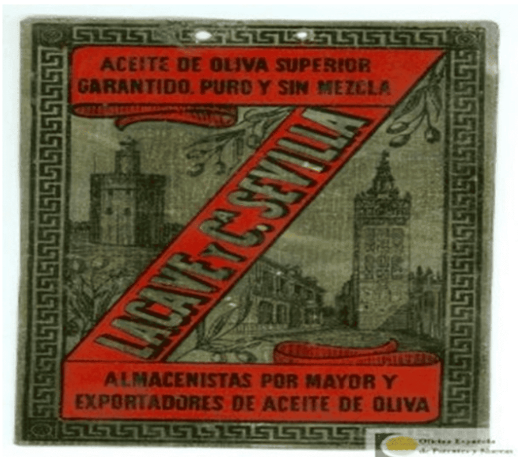
Ilustración 1. Diseño de la marca registrada de aceite de oliva Lacave (1888)