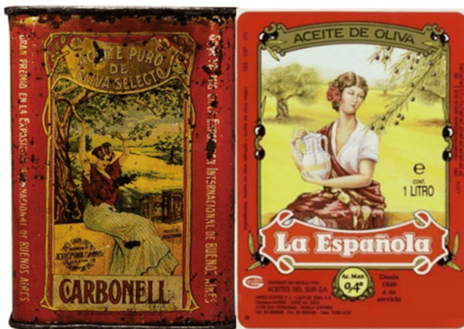
Ilustración 5. Lata de la década de 1910 de Carbonell y etiqueta de La Española (circa 1990)