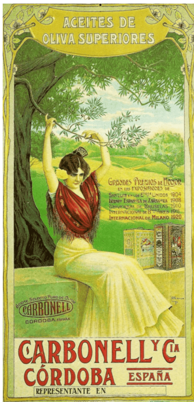
Ilustración 3. Cartel La Gitana (1904)