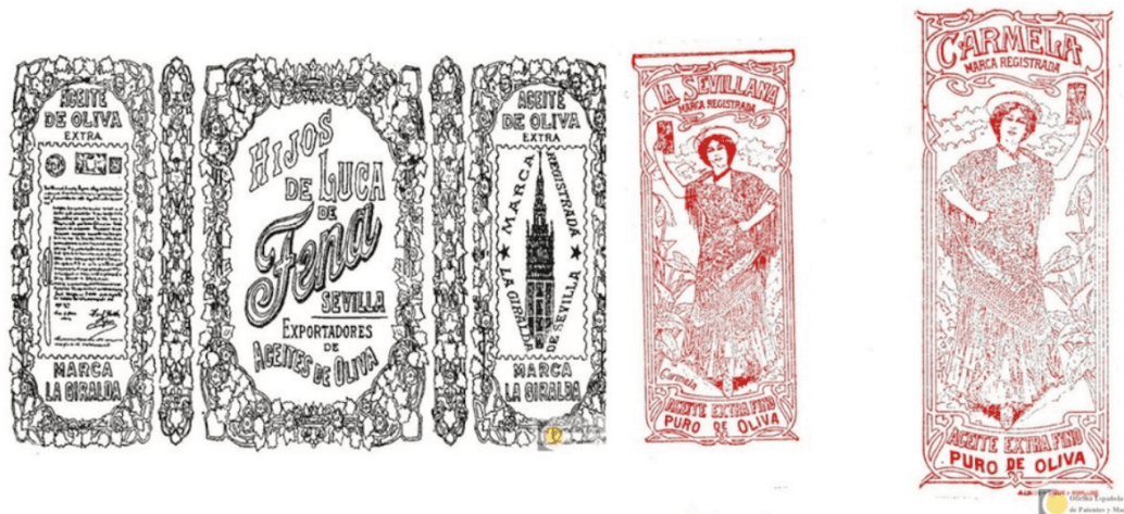
Ilustración 4. Litografías para La Giralda y Carmela (1908)