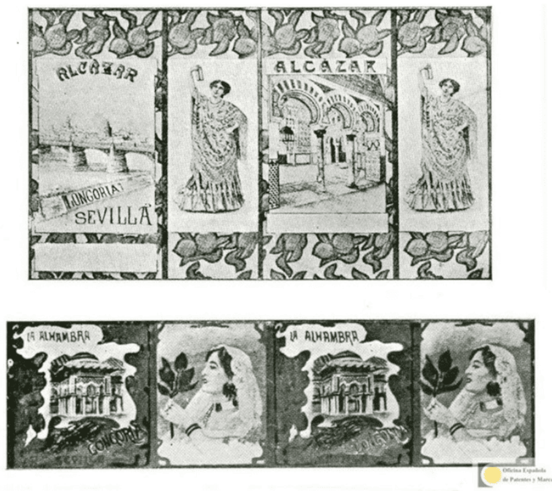
Ilustración 2. Litografías para las latas de aceite de oliva Alcázar y La Alhambra (1904)