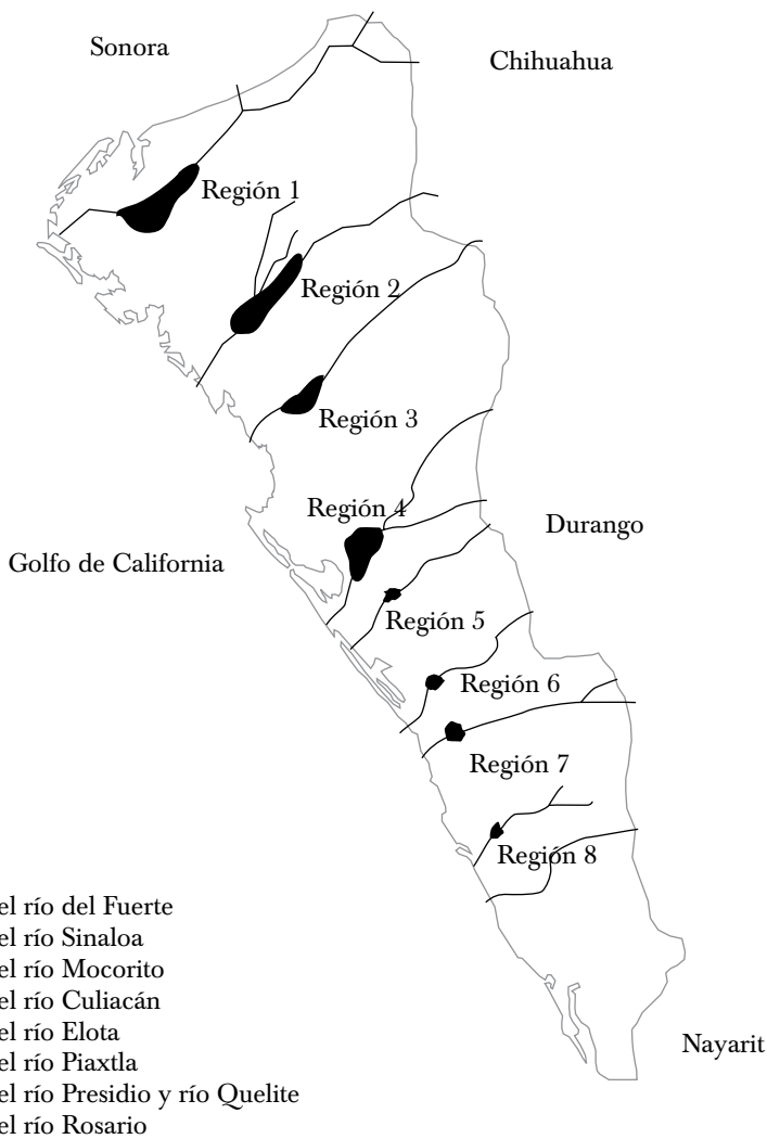
MAPA 2. REGIONES AGRÍCOLAS DEL ESTADO DE SINALOA