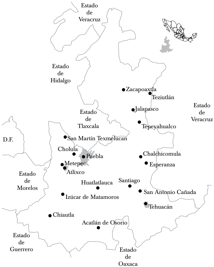
MAPA 2. ASENTAMIENTOS DE ESPAÑOLES EN PUEBLA, 1930